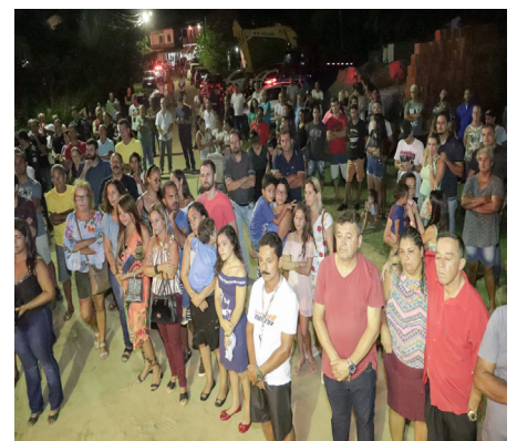
Moradores da Mombaça durante o evento