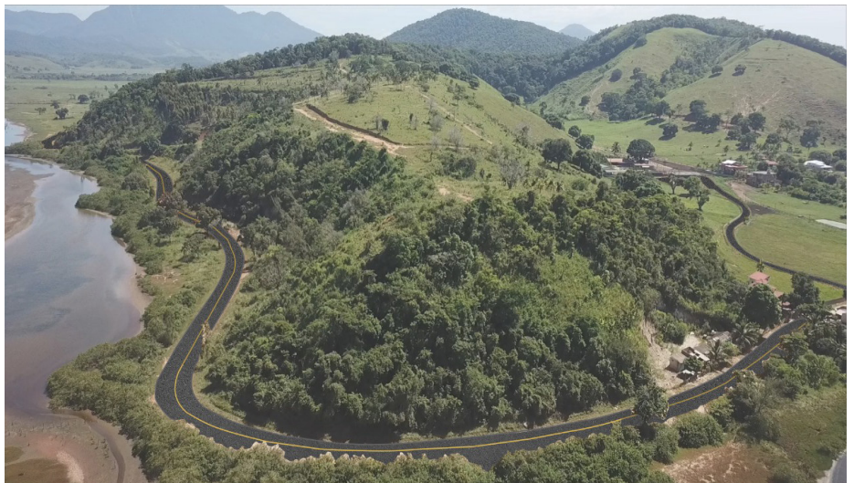
Estrada terá 8 quilômetros de vias drenadas e pavimentadas. Obras estão em andamento