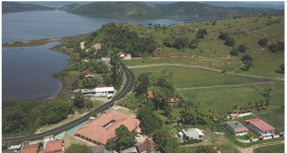
Nova Estrada da Mombaça trará mais dignidade, conforto e segurança aos moradores

A pavimentação da Mombaça já começou e contará com duas frentes de obras, de forma a agilizar a conclusão dos serviços. Para acompanhar o andamento, o cidadão poderá seguir a Prefeitura de Saquarema no Facebook. O endereço é facebook.com/PrefeituraSaquarema