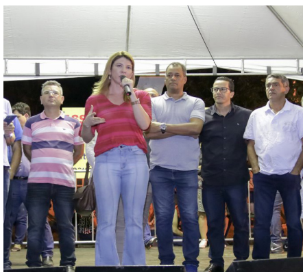
Prefeita Manoela Peres durante discurso