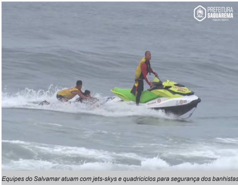
Equipes do Salvamar atuam com jets-skys e quadriciclos para segurança dos banhistas