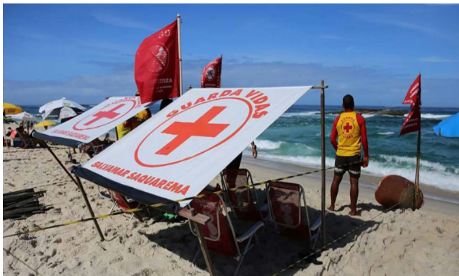
Salvamar é responsável por garantir a segurança em 38 quilômetros de orla da cidade

Para os próximos meses, o Grupamento Marítimo de Saquarema fará novos cursos para os guarda vidas, promovendo o treinamento e aperfeiçoamento da tropa.