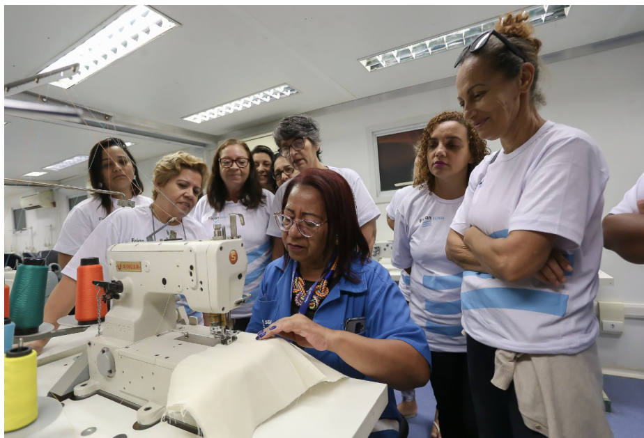
Alunos poderão atuar na indústria, fábricas domiciliares, cooperativas e associações

“Esse é mais um curso gratuito que o nosso Centro de Capacitação Profissional está oferecendo na cidade. Já formamos centenas de alunos em cursos nas áreas administrativas, automobilística e construção civil. Agora, na área de vestuário, estaremos capacitando mais pessoas para o mercado de trabalho. Estou muito feliz em poder dar esta oportunidade para nossos moradores”, afirmou a Prefeita Manoela Peres.