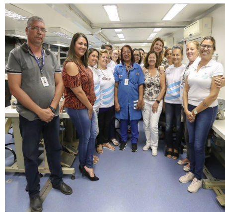
Primeira turma de alunos do novo curso

O Centro de Capacitação Profissional fica na Rua Tiá Melo, 25, em São Geraldo, Bacaxá. Para saber mais sobre os cursos oferecidos, é só acessar o site da Prefeitura www.saquarema.rj.gov.br