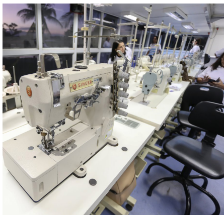
Alunos terão todo maquinário à disposição