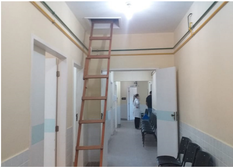
Obras de adequação do PU de Saquarema ofertarão mais 12 leitos para cidade

A Prefeitura de Saquarema , por meio da Secretaria Municipal de Saúde, está finalizando as obras de adequação e reforma do Posto de Urgência (PU) 24 horas de Saquarema. A unidade será o local especializado no atendimento aos pacientes com o novo Coronavírus na cidade.