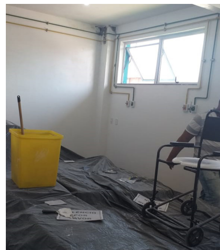
PU Saquarema receberá pacientes com Covid

Todas as informações referentes ao Coronavírus podem ser consultadas nos canais oficiais de comunicação da Prefeitura de Saquarema . A população pode acessar o site saquarema.rj.gov.br ou a fanpage em Facebook.com/PrefeituraDeSaquarema