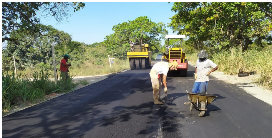
Obras no balneário de Vilatur contemplam mais de 9 quilômetros de pavimentação

Com a construção da Estrada dos Cajueiros, o acesso ao balneário será feito de forma mais rápida e segura. Além de melhorar a mobilidade de moradores e turistas, a pavimentação da via será uma ferramenta importante para o fomento do turismo e a geração de empregos na região.