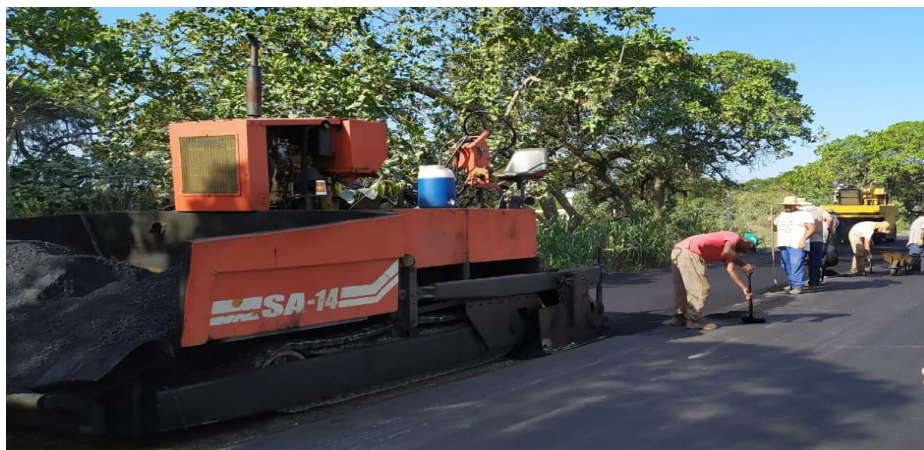
Pavimentação da Estrada dos Cajueiros facilitará o acesso ao balneário de Vilatur