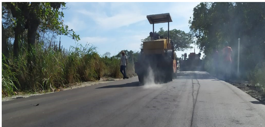
Além da Estrada dos Cajueiros, outras vias de Vilatur também foram pavimentadas