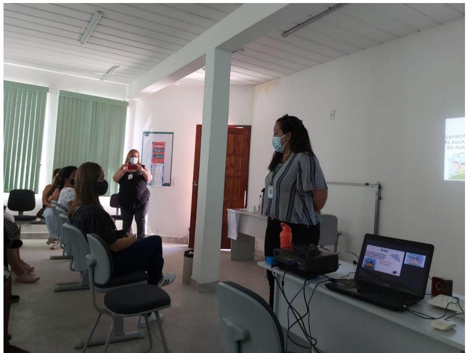
Capacitação contra o Covid é voltada para funcionários da Secretaria de Educação

As reuniões servirão para que as equipes multipliquem as boas ações e práticas para os demais funcionários da rede municipal de educação.