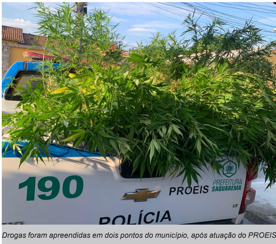
Drogas foram apreendidas em dois pontos do município, após atuação do PROEIS

“Demos um grande prejuízo para o tráfico de drogas na cidade. A atuação do PROEIS, juntamente com as demais forças de segurança atuantes na cidade, serviu