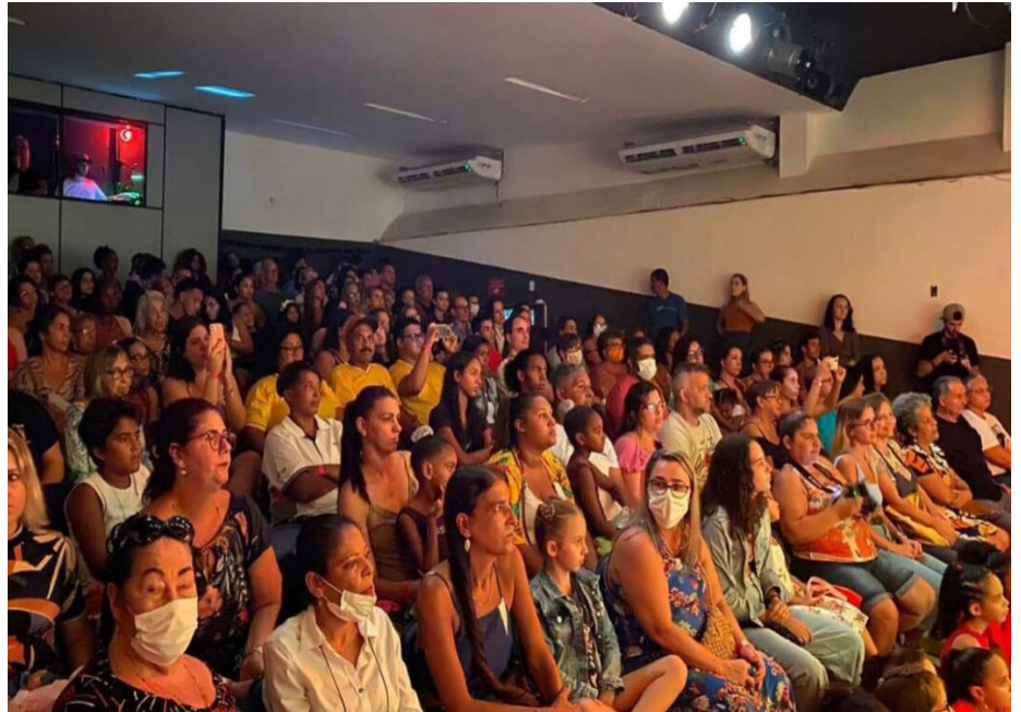
Ingressos para os dois espetáculos já estão disponíveis para compra e retirada