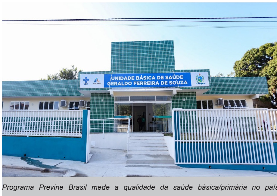
Programa Previne Brasil mede a qualidade da saúde básica/primária no país

Saquarema foi destaque por seu desempenho no Previne Brasil, programa do Ministério da Saúde. No primeiro quadrimestre de 2022, o município apresentou uma grande evolução no indicador sintético final (ISF), conquistando o primeiro lugar entre as cidades da Baixada Litorânea e da Região Metropolitana 2, tendo o melhor desempenho na Atenção Básica. Com a ótima pontuação, Saquarema também conquistou o sétimo lugar entre os 92 municípios do Estado.