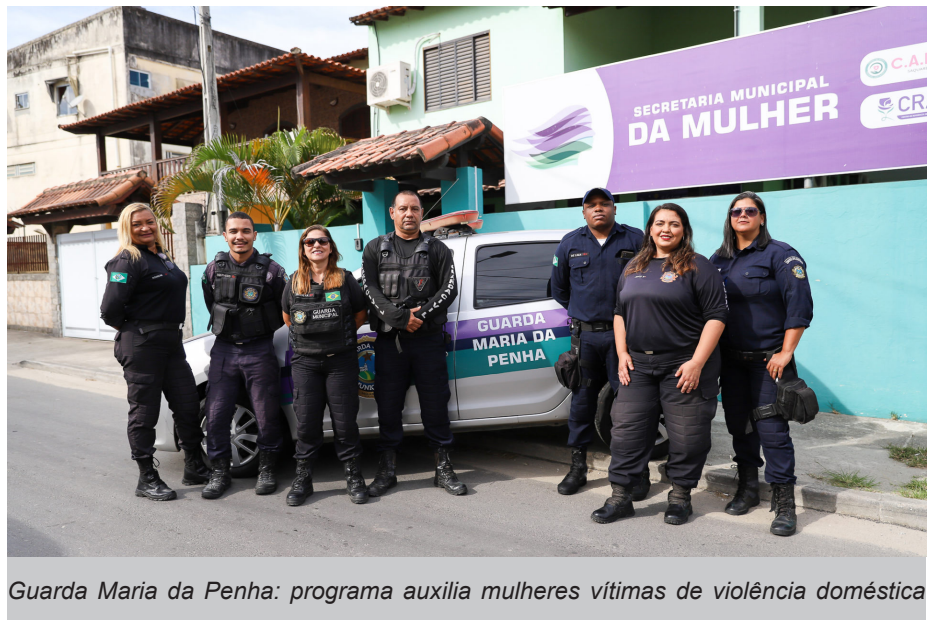
Guarda Maria da Penha: programa auxilia mulheres vítimas de violência doméstica