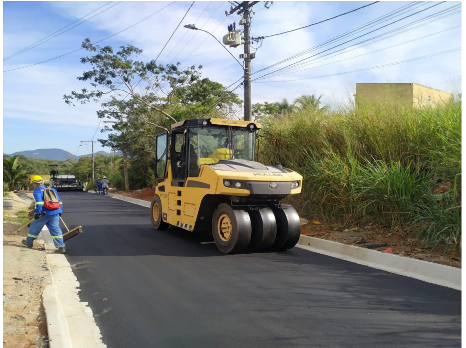
Pavimentação do bairro Bicuíba contemplará mais de dois quilômetros de vias

O programa Saquarema Não Para é o maior pacote de obras e intervenções já realizado na história da cidade de Saquarema. Ao todo, 140 quilômetros de vias e estradas serão drenadas e pavimentadas. Além disso, há a previsão de implantação de nova iluminação, urbanização e construção de pontes na cidade.