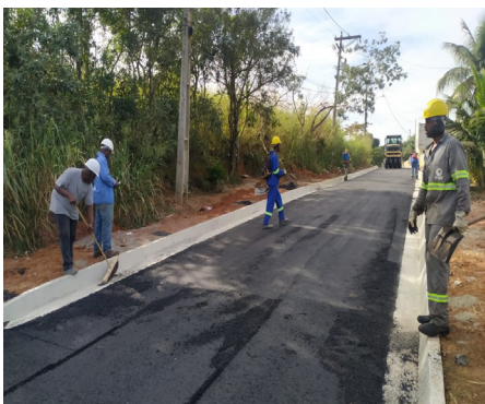
Obras que trazem mais qualidade de vida