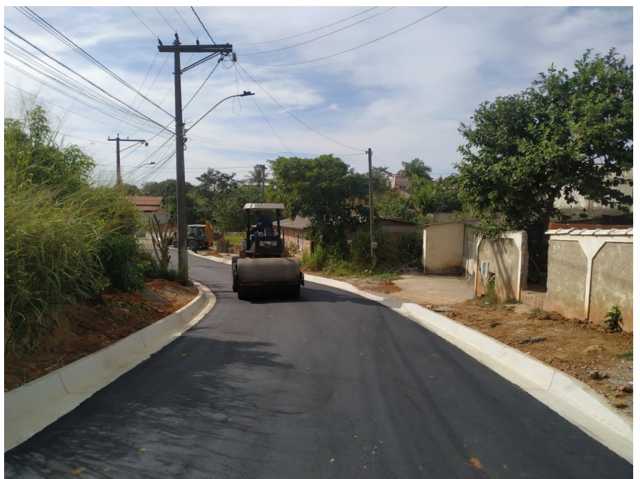
Obras de pavimentação fazem parte do Programa Saquarema Não Para