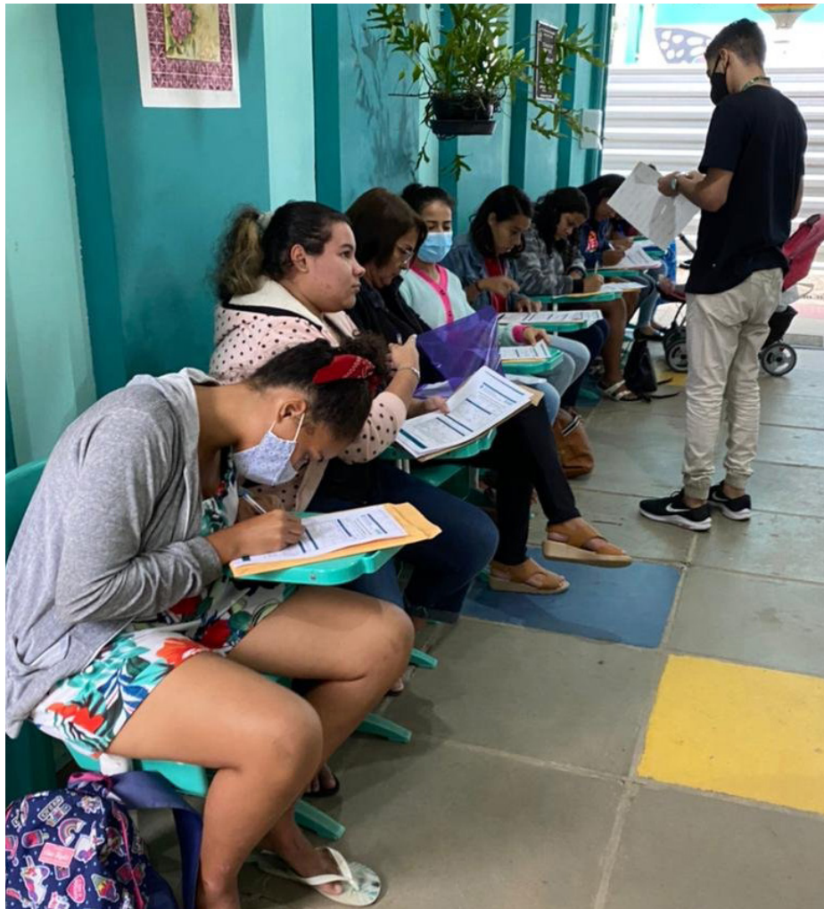
Programa Novo Cidadão: oportunidade para moradores de baixa renda da cidade

As condições para participar do Programa “Novo Cidadão” são residir, pelo período mínimo de 5 (cinco) anos, no Município de Saquarema; ter idade entre 18 (dezoito) e 29 (vinte e nove) anos, ou superior a 50 (cinquenta) anos; possuir ensino médio completo; e estar desempregado