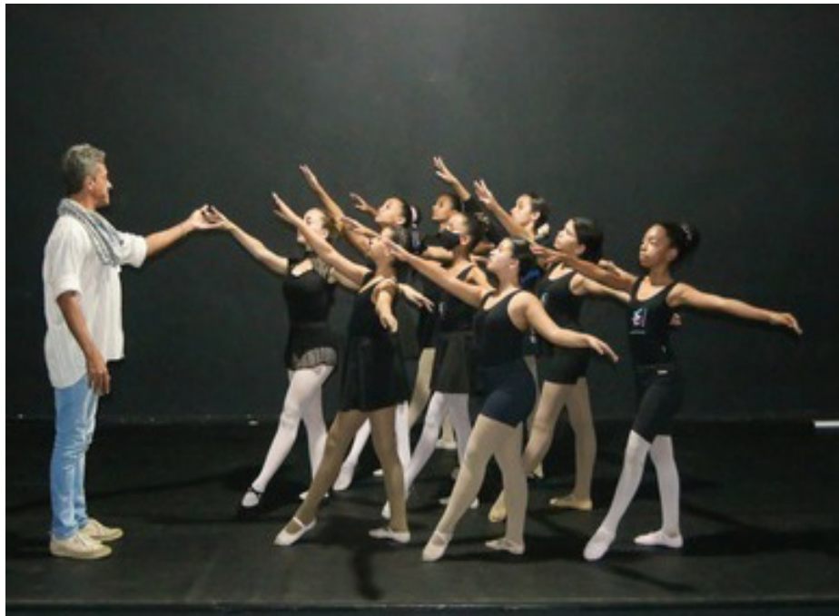
Primeira turma de ballet municipal: aulas realizadas no Teatro Mário Lago

Neste primeiro momento, as atividades estão focadas na consolidação do ensino das técnicas da dança clássica e na construção de coreografias que possibilitem futuramente a participação do