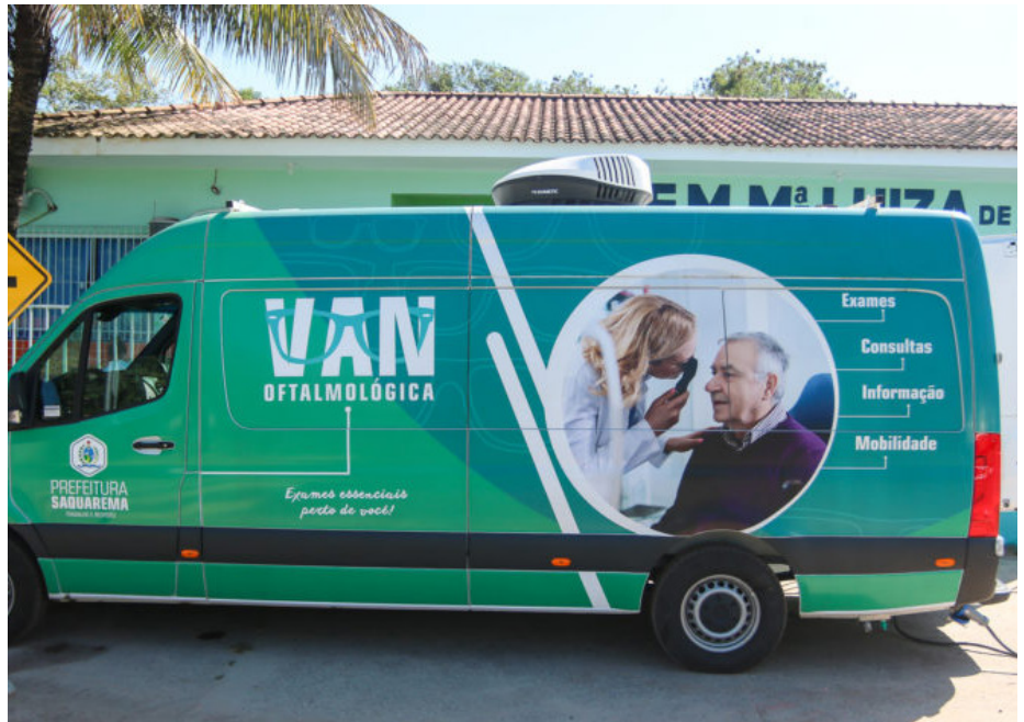
Veículo realizará exames e consultas, de forma gratuita, nas escolas municipais

A primeira unidade escolar a receber a Van Oftalmológica foi a Escola Municipal Maria Luiza de Amorim Mendonça, localizada no bairro de Rio Mole. No local, aproximadamente 30 alunos foram atendidos no primeiro dia da ação. Durante a consulta, as crianças passaram pelo auto refrator, para verificação da acuidade visual, aplicação de colírio para dilatação das pupilas, exames de fundoscopia, ou o popular, exame de fundo de olho e pela Biomicroscopia, mais conhecido como exame na lâmpada de fenda. Por último, o exame de refração, que detecta quanto o paciente consegue