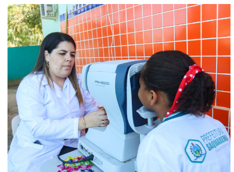
Rio Mole foi o primeiro bairro a ter o projeto

29/09 – Escola Municipal Beatriz Amaral.