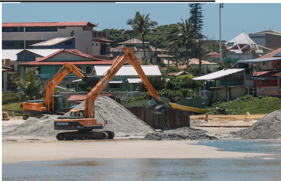
Obras executadas pelo INEA foram paralisadas após solicitação do Ministério Público Federal

Com a publicação do Decreto Municipal, o INEA pode atuar emergencialmente fa-