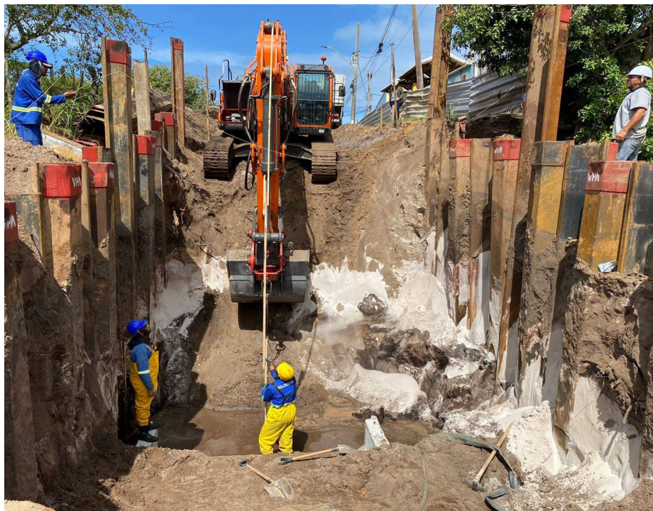
Equipes trabalham na drenagem das ruas que receberão pavimentação asfáltica

Criado pela Prefeitura, o programa Saquarema Não Para prevê obras em mais de 140 quilômetros de ruas e estradas em diversos bairros da cidade.