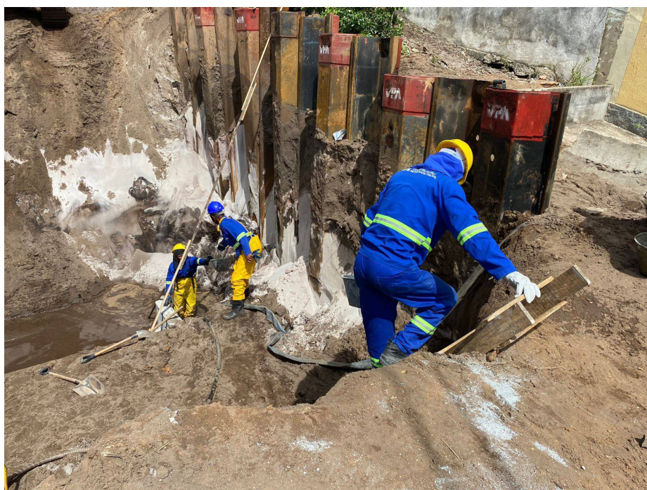
Programa Saquarema Não Para prevê drenagem e pavimentação de 140 km de vias