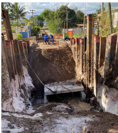
Obras de drenagem no bairro Coqueiral