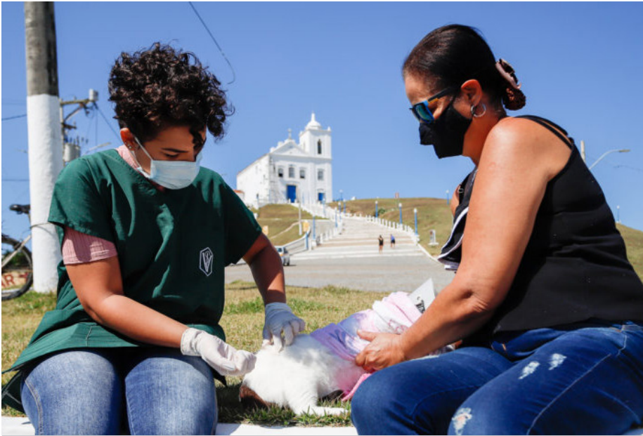
Posto Volante de vacinação será montado ao lado do ESF do bairro Rio d'Areia

Atenção, moradores do Rio d'Areia e região! As equipes da Secretaria de Saúde e