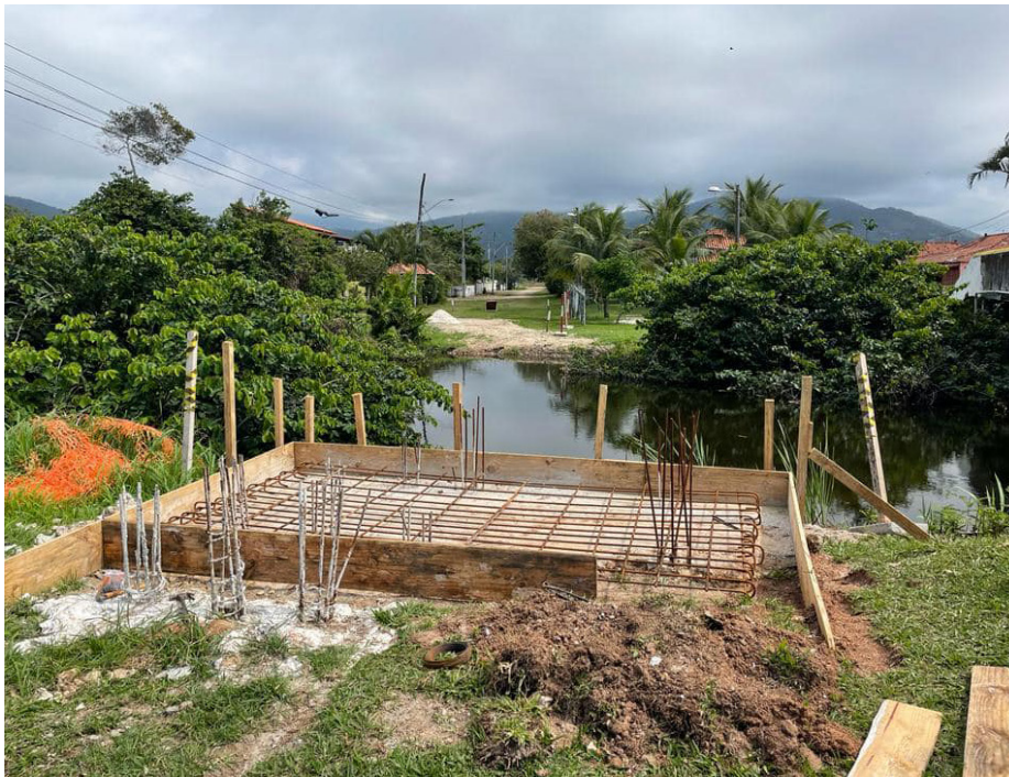
Uma das cinco novas passarelas que estão sendo construídas em Jaconé

A Prefeitura de Saquarema, por meio da Secretaria Municipal de Obras Públicas, está construindo cinco novas passarelas de pedestres no bairro de Jaconé. As estruturas estão sendo montadas nas ruas 11, 71, 52, 03 e 79, nesta ordem.