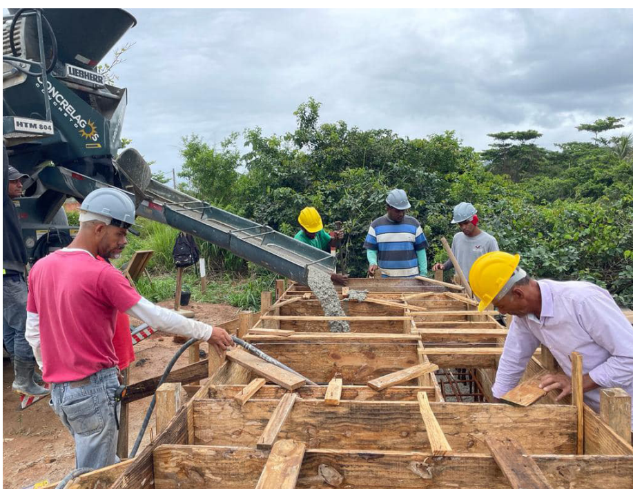
Equipes trabalham na concretagem das estacas e blocos da base das passarelas

As cinco passarelas serão novas alternativas para acesso de pedestres da Avenida Beira Mar às principais vias do bairro. Ao término das intervenções, o bairro contará com 9 passarelas de pedestres construídas, complementando as outras quatro já entregues em 2020, nas ruas 88, 91, 95 e 100.