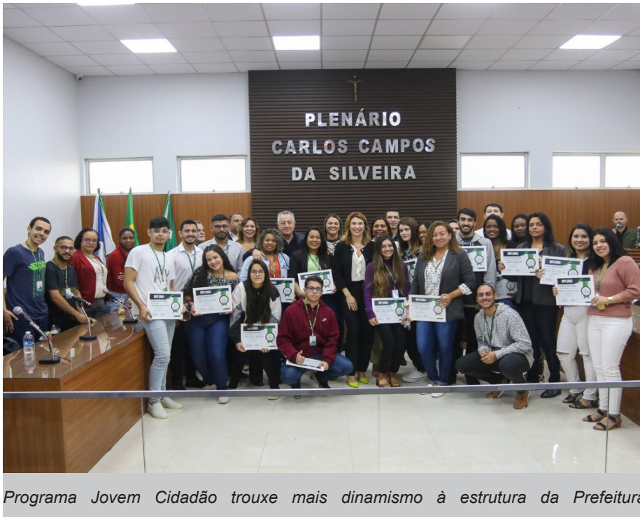
Programa Jovem Cidadão trouxe mais dinamismo à estrutura da Prefeitura

A Prefeitura de Saquarema torna público o lançamento do Chamamento Público nº 005/022 para a contratação de estudantes estagiários de Nível Superior, dentro do Programa Jovem Cidadão.