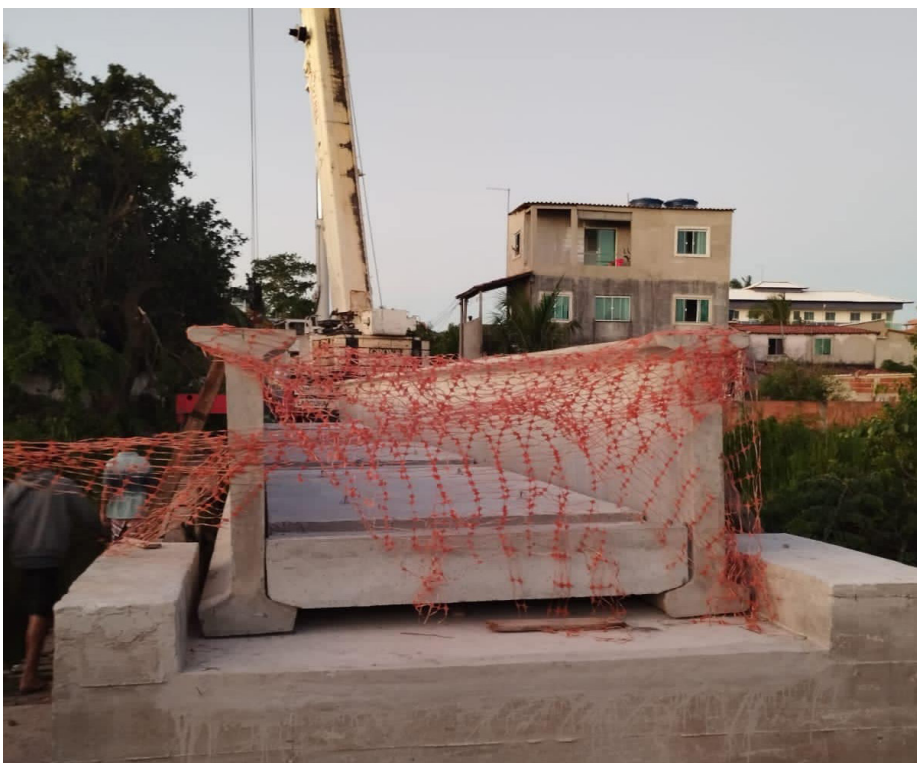
Novas passarelas estão sendo instaladas nas ruas 03, 11, 52, 71 e 79

A Prefeitura de Saquarema, por meio da Secretaria Municipal de Obras Públicas, avança com a construção das novas passarelas do bairro de Jaconé. Nesta semana, os serviços foram realizados na rua 71.