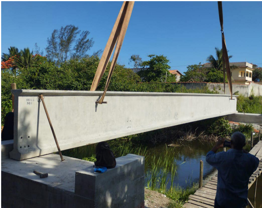
Cinco novas passarelas de pedestres estão sendo construídas no bairro de Jaconé