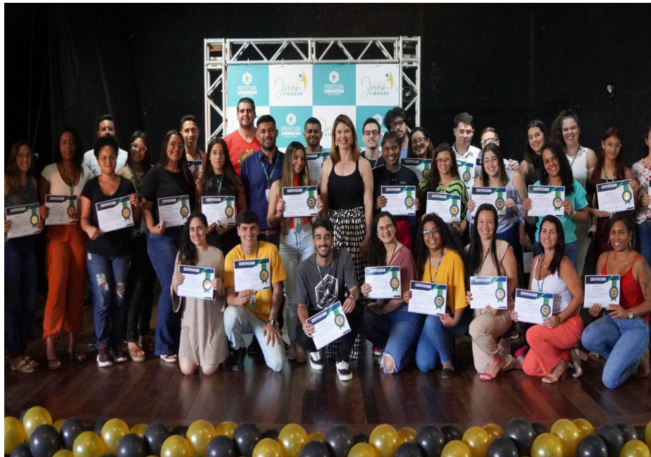
Trinta e cinco estagiários receberam o Certificado de Participação e Conclusão do PJC