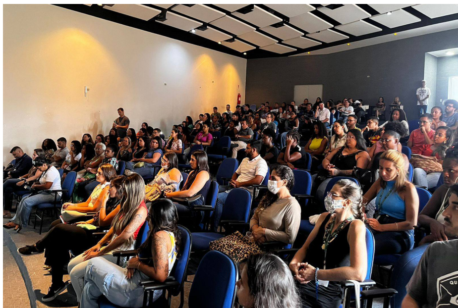
Programa Jovem Cidadão completou quatro anos de atividades na Prefeitura