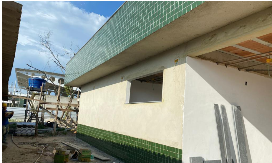
Nova Clínica da Mulher, na Cidade da Saúde, terá mais serviços e procedimentos

A nova Clínica da Mulher terá 8 consultórios, inclusive 1 odontológico, além de salas de preventivos, ultrassom, mamografia, vacinas, atividades coletivas, administrativas, farmácia, entre outras. Em anexo ao prédio principal, haverá o banco