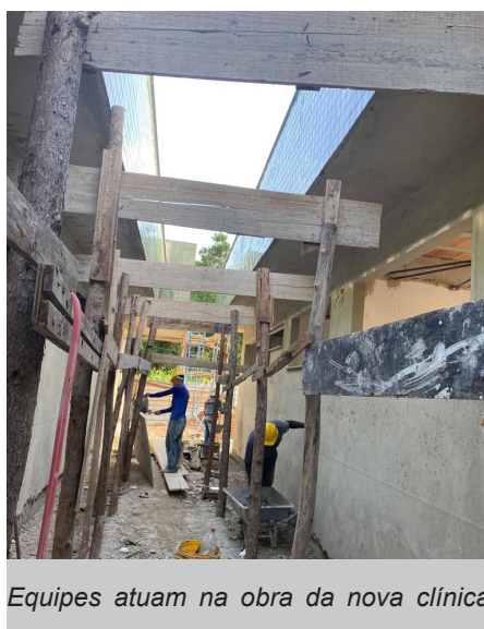
Equipes atuam na obra da nova clínica