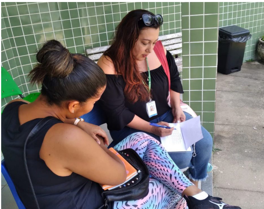
Pesquisadores da Prefeitura percorrerão todos os postos de saúde do município

A Prefeitura de Saquarema, por meio da Secretaria Municipal de Saúde, iniciou pesquisa de qualidade nos postos de Estratégia de Saúde da Família – ESF. O objetivo é buscar entender como pacientes e profissionais estão se comportando no dia a dia nas unidades médicas. A coordenação dos trabalhos está com a equipe de Promoção da Saúde.