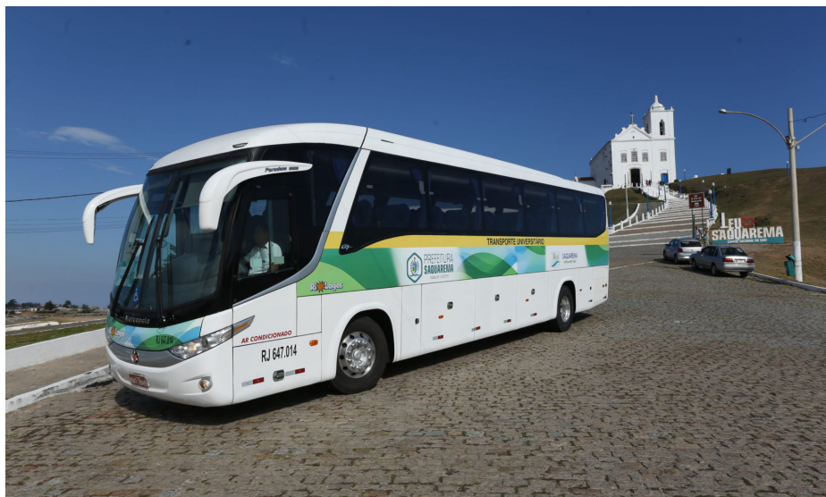
Estudantes de Saquarema poderão realizar a renovação do Transporte Universitário

Demais universidades particulares de Niterói: 26, 27, 30 e 31 de janeiro.