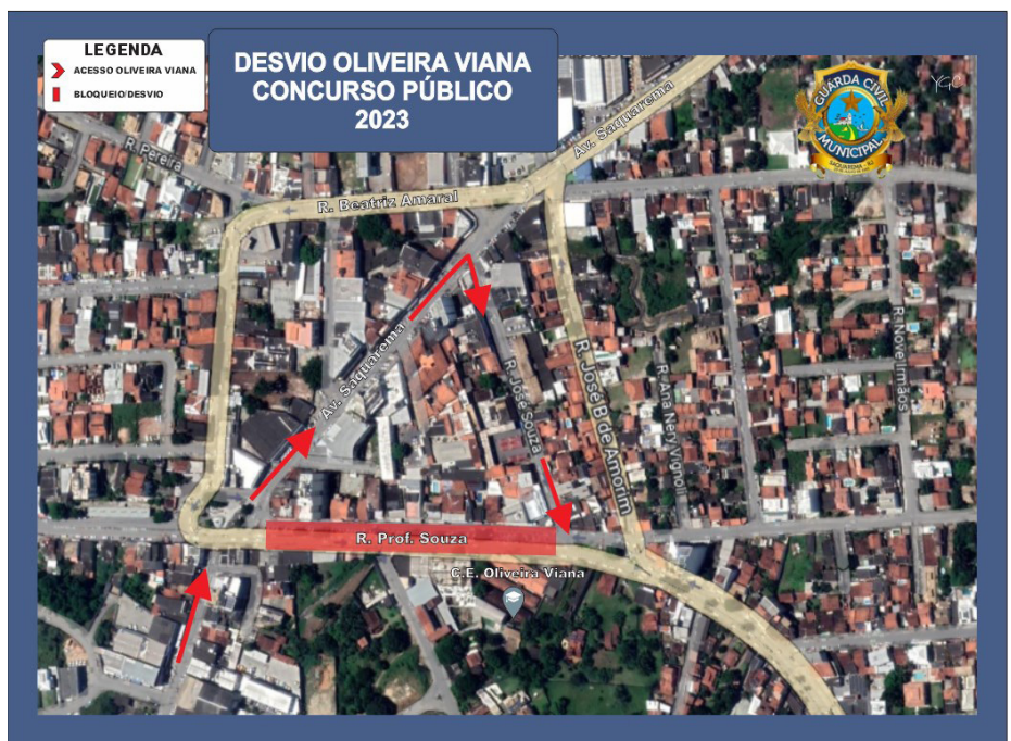
Rua Prof. Souza será interditada na altura do Colégio Oliveira Viana