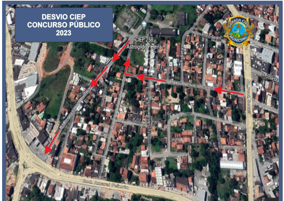
Acesso ao CIEP de Bacaxá será feito pelas ruas Prof. Souza e Humbelina Matos

Já os candidatos que foram alocados no Colégio Estadual Oliveira Viana deverão acessar o local de prova pela Avenida Saquarema e Rua José de Souza (rua da Policlínica).