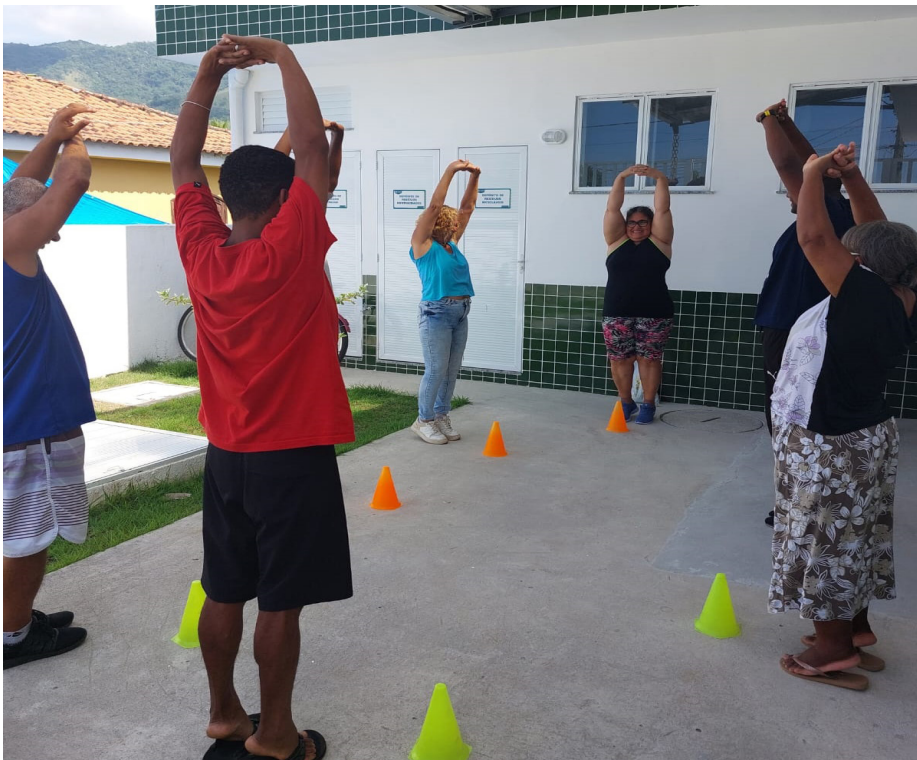
Pacientes realizam atividades físicas no projeto Hiperdia Saudável, da ESF em Sampaio

A Prefeitura de Saquarema está desenvolvendo no posto de Estratégia de Saúde da Família de Sampaio Corrêa, o projeto Hiperdia Saudável. Voltado para os pacientes hipertensos e diabéticos, o trabalho consiste em encontros quinzenais na unidade para verificação de pressão arterial e o hemoglicoteste (HGT), além da verificação de peso, altura e cálculo do Índice de Massa Corpórea.