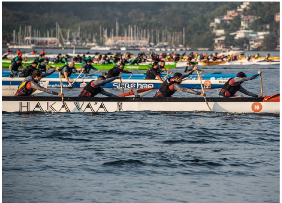
Campeonato Estadual retorna à Região dos Lagos. Etapas não aconteciam desde 2019

Com patrocínio da Prefeitura de Saquarema , esta edição marca um recorde em premiações para o esporte no Brasil. Ao todo, R$ 50 mil reais estarão em disputa, sendo a categoria OC6 a que oferece a maior recompensa aos atletas. Tanto no masculino quanto no feminino, as equipes que ficarem em primeiro lugar irão receber R$ 6 mil. As segundas e terceiras colocações recebem R$ 3 mil e R$ 1,5 mil cada. De acordo com a Federação de Canoa Havaiana do Estado do Rio de Janeiro (FCHERJ), o número de participantes do campeonato também deve bater um novo recorde com mais de 500 inscritos de di-