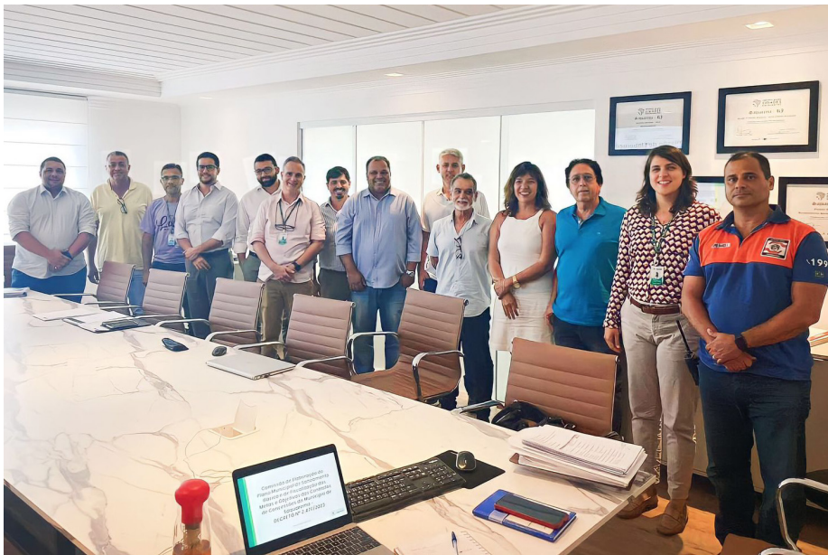
Comissão é formada por secretários e técnicos da Prefeitura de Saquarema

A Prefeitura de Saquarema reuniu secretários, membros titulares e suplentes da Comissão instituída pelo Decreto 2.476/2023, para uma reunião que marcou o início dos trabalhos de elaboração do Plano Municipal de Saneamento Básico e a fiscalização das metas e objetivos dos contratos de concessão do município. O encontro foi realizado nesta quarta-feira, na sede da Prefeitura.