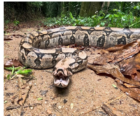
Jiboia tinha, aproximadamente, 1,5 metros

99279-0540 ou do e-mail guardaambiental@saquarema.rj.gov.br e solicitar o resgate. No caso de cobras, as instruções são manter o afastamento, isolar a área e acionar a Guarda.