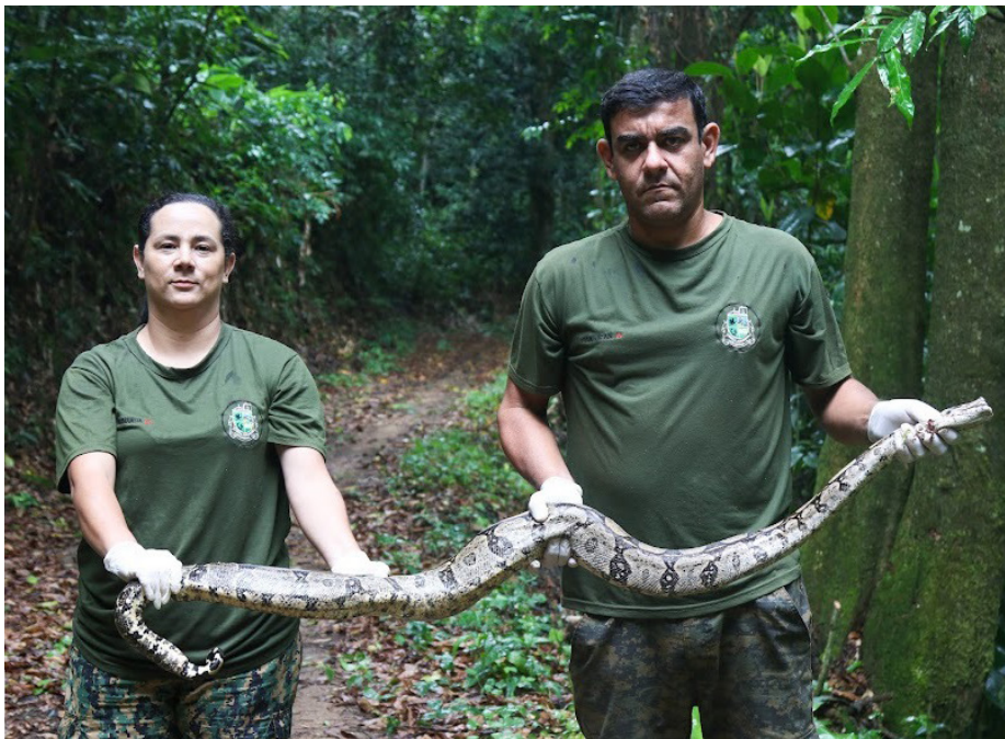
Jiboia foi resgatada pelos agentes da Guarda Ambiental no bairro de Jacané

Nesta segunda-feira, 27, agentes da Guarda Ambiental de Saquarema foram acionados para resgate de uma jiboia, no bairro de Jacané. A serpente estava dentro do quintal de uma residência cujo morador, ao avistar o animal, imediatamente entrou em contato com a Guarda Ambiental. Após localizada, a cobra foi identificada como uma jiboia macho, adulta, com aproximadamente 1,50 metros. O animal foi resgatado e solto em seu habitat.