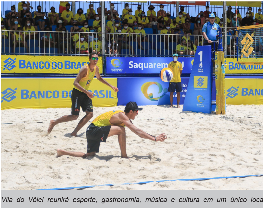
Vila do Vôlei reunirá esporte, gastronomia, música e cultura em um único local

A Prefeitura de Saquarema preparou uma vasta programação para a Vila do Vôlei, estrutura que está sendo montada no Campo de Aviação para receber as etapas do Mundial de Vôlei de Praia, do Campeonato Brasileiro Sub21 e do Campeonato Brasileiro Adulto (Top 8 e Aberto). Com programação gratuita, a vila contará com atividades culturais, gastronomia, shows com música ao vivo e muito mais!