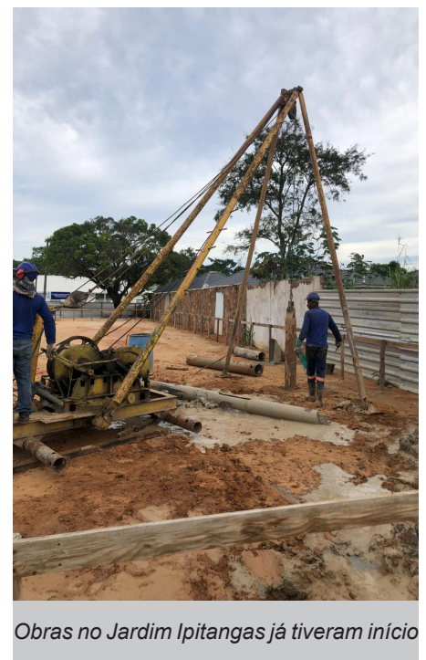
Obras no Jardim Ipitangas já tiveram início

De acordo com o cronograma da Secretaria Municipal de Obras, a expectativa é de que a obra da nova creche do Jardim Ipitangas, que beneficiará em torno de 100 crianças, seja concluída em até 6 meses. Jaconé, Rio d’Areia, Asfalto Velho e Bonsucesso também contarão com novas creches no sistema modular. As obras já estão em andamento.