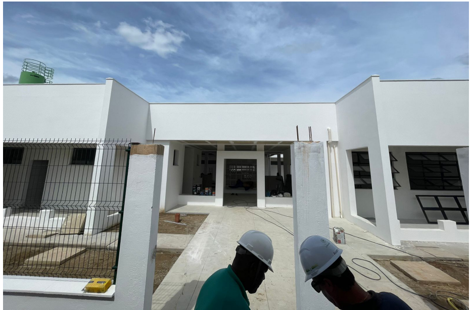
Creche do bairro Verde Vale, na Cidade da Saúde, está com obras mais adiantadas

“Diferentemente da obra do Verde Vale, a creche de Ipitangas segue o novo padrão utilizado pela Prefeitura de