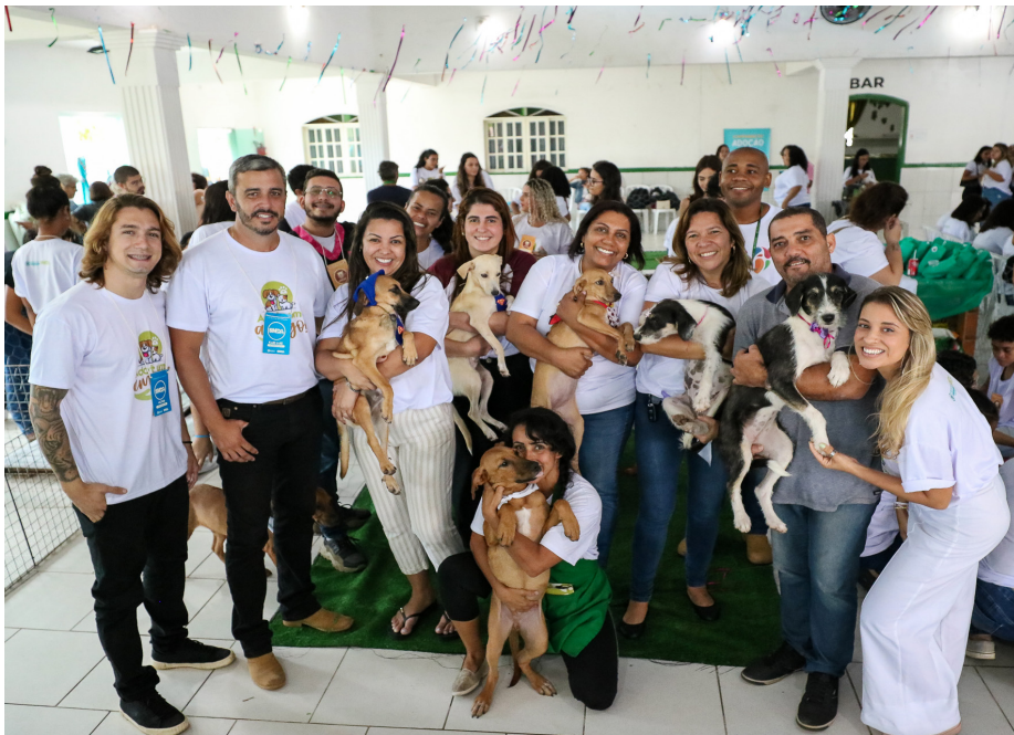
Primeira campanha municipal de adoção movimentou o Saquarema Futebol Clube

A Prefeitura de Saquarema, através da Secretaria Municipal dos Direitos dos Animais realizou neste sábado, dia 29 de abril, a primeira edição da Campanha de Adoção de animais domésticos no município