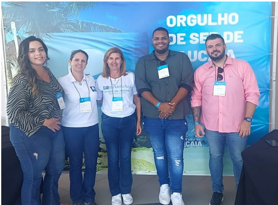
Equipe da Secretaria de Esporte, Lazer e Turismo participou do evento, no Ceará

A cidade de Caucaia, no Ceará, recebeu representantes de vários estados do país para a realização do XVI Workshop Nacional do Programa Bandeira Azul, programa que está presente em 50 países e com mais de 5 mil bandeiras espalhadas pelo mundo. O Brasil possui 40 bandeiras em 21 municípios, incluindo Saquarema, com a Praia de Itaúna.