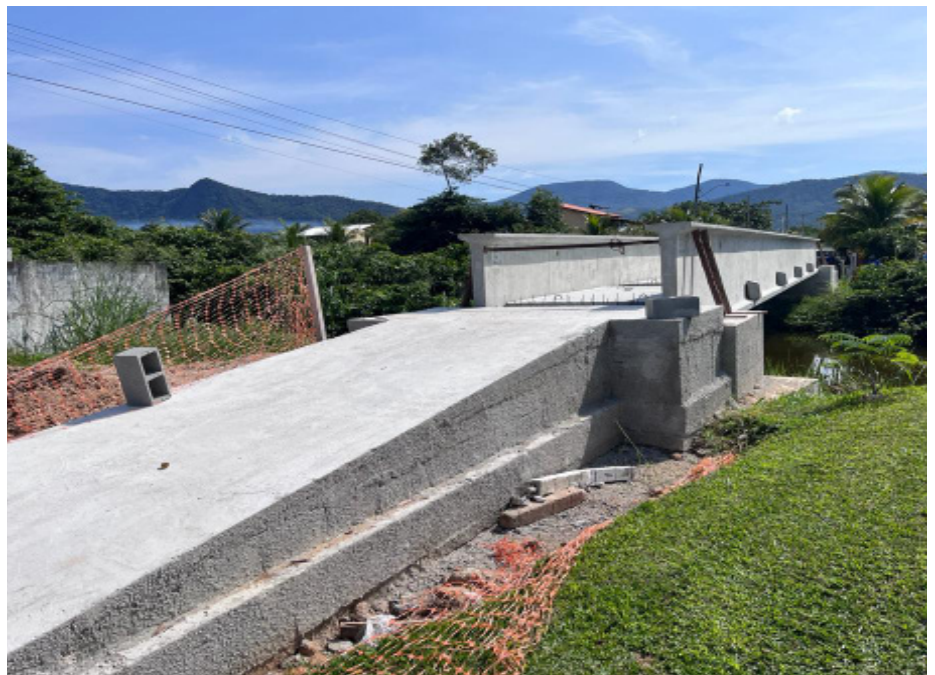
Cinco novas passarelas estão sendo construídas pela Secretaria de Obras Públicas