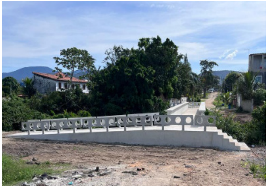
Novas passarelas garantem maior mobilidade para moradores do bairro de Jacomé

Com a finalização da obra, o bairro contará com 9 passarelas de pedestres construídas, complementando as outras 4 já entregues em 2020, nas ruas 88, 91, 95 e 100.