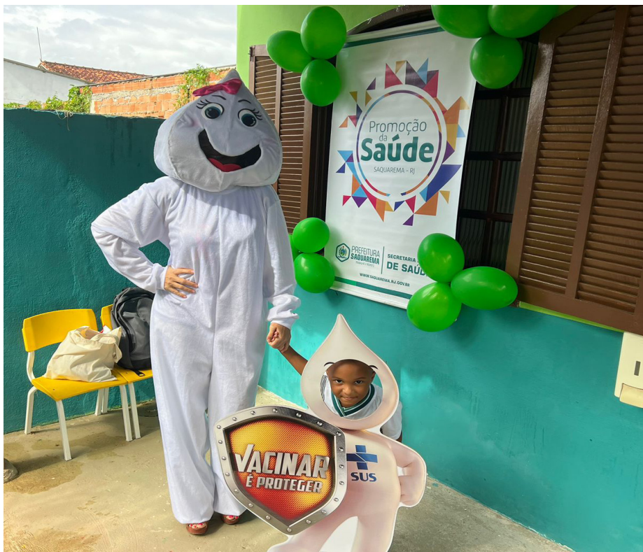
Projeto Caderneta Ok visita creches da Rede Municipal de Educação em Saquarema

Na última segunda-feira (19), a Prefeitura de Saquarema, através da Secretaria Municipal de Saúde realizou mais uma atividade do projeto “Caderneta Ok”.