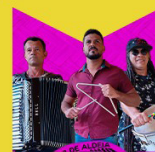
OS 3 DE ALDEIA