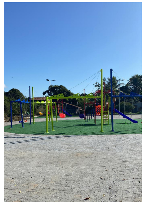
Parquinho da Praça do Asfalto Velho

contém espaço de convivência e iluminação em led, garantindo mais eficiência energética, economia e qualidade de iluminação.