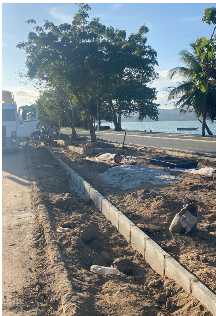
Nova praça próxima à orla do bairro Areal