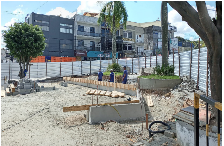
Projeto Uma Praça em Cada Bairro executa melhorias na Praça de Santo Antonio

As novas praças representarão importantes opções de lazer para crianças, jovens e adultos dos bairros da cidade. Além dos espaços de recreação, as novas praças