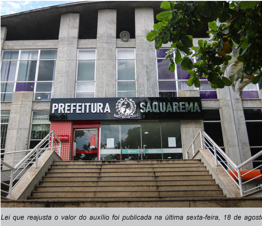
Lei que reajusta o valor do auxílio foi publicada na última sexta-feira, 18 de agosto

A Prefeitura de Saquarema publicou nesta sexta-feira, 18 de agosto, em Diário Oficial, a Lei 2.435 que trata do reajuste do auxílio concedido aos servidores públicos aposentados e pensionistas vinculados ao IBASS, Instituto de Benefícios e Assistência dos Servidores Municipais de Saquarema. O novo valor passa a ser de R$ 650,00.