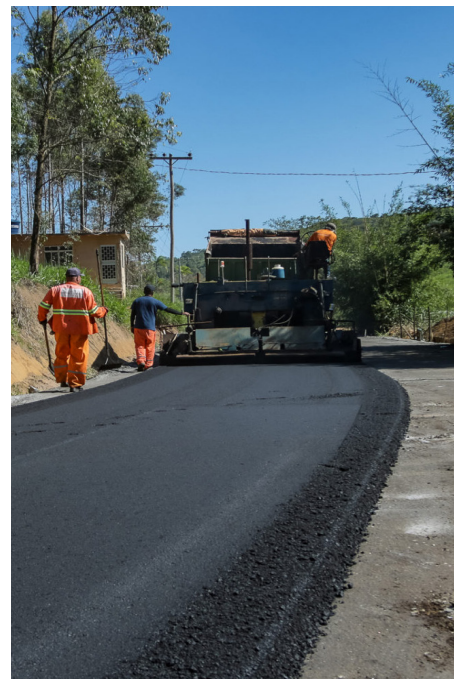
Mais qualidade de vida para moradores

Para acompanhar o andamento desta e outras obras, siga as redes sociais da Prefeitura de Saquarema no Facebook, Instagram e YouTube. Pesquise por @prefeiturasaquarema e fique por dentro de tudo o que acontece na cidade.