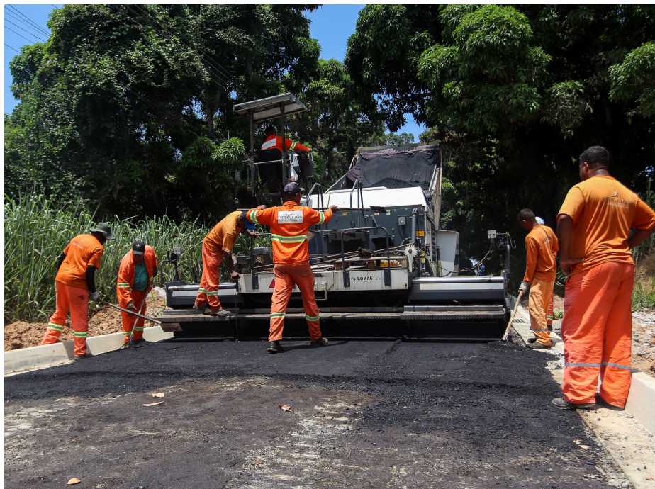
Mais de 4 quilômetros de ruas e estradas serão pavimentadas no Engenho Grande

“Estamos avançando com o “Saquarema Não Para” no bairro Engenho Grande, com mais de 4 quilômetros de obras de drenagem e pavimentação. Tenho certeza de que com a conclusão das obras, traremos mais mobilidade e qualidade de vida para a população”, afirmou a