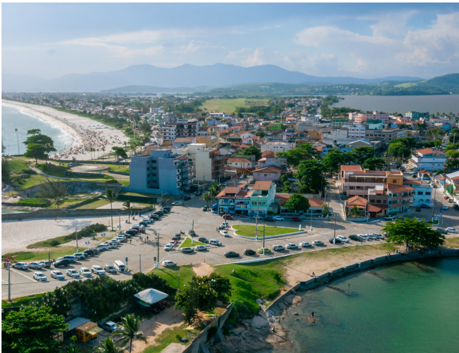
O Ranking de Competitividade dos Municípios fornece suporte aos líderes públicos

O Centro de Liderança Pública (CLP) em parceria com a Gove, divulgou o Ranking de Competitividade dos Municípios, que avalia a capacidade de um governo em proporcionar um maior bem-estar social e elevar o padrão de vida da sua população. A pesquisa, que abrange 410 municípios com mais de 80 mil habitantes, apontou Saquarema figurando entre os municípios de destaque no cenário nacional.