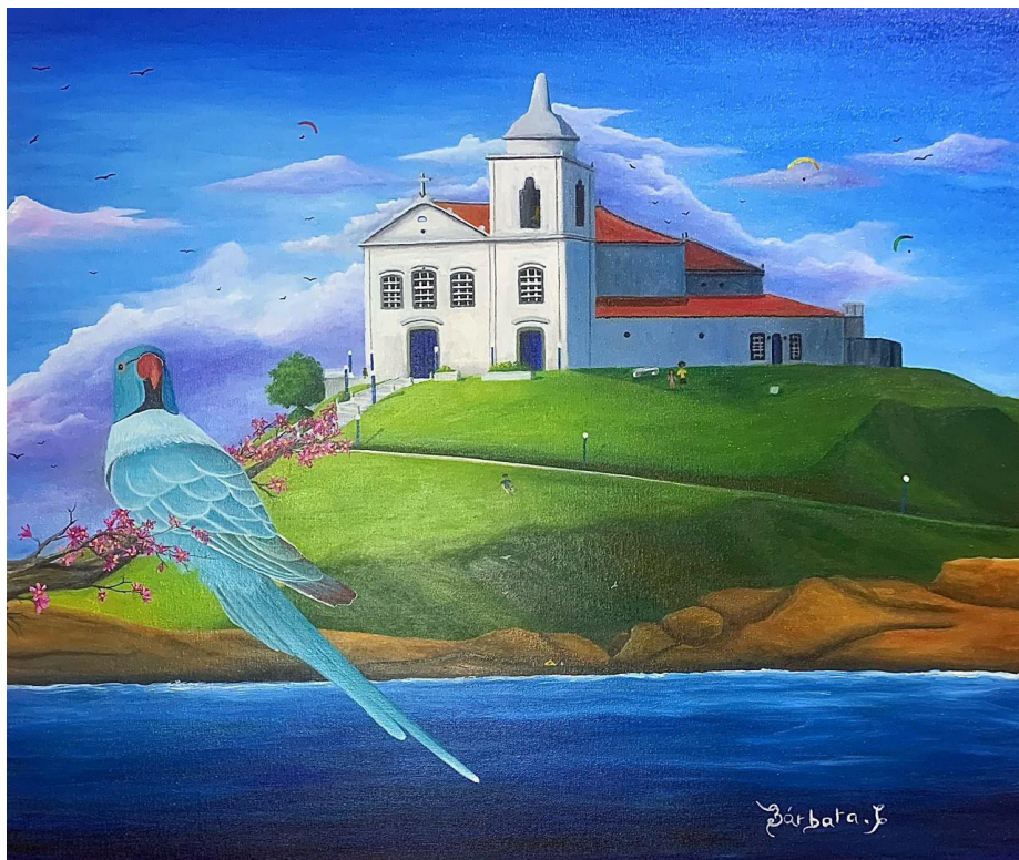
Exposição traz diversas obras das artistas Bárbara Corrêa e Flavy Bastos

As artistas possuem estilos e técnicas diferentes. Bárbara tem carreira consolidada e apresenta paisagens, animais e figuras humanas diversas, enquanto Flavy tem como inspiração o surrealis-