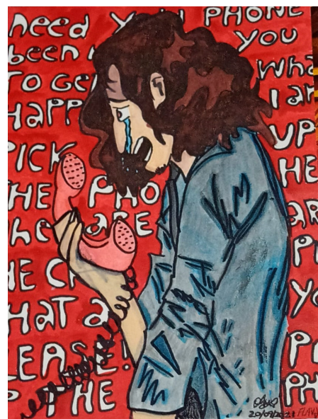
Exposição: arte como superação de vida

A Casa de Cultura Walmir Ayala funciona de segunda a sexta-feira, das 09 às 17 horas, na Rua Coronel Madureira, 88, no Centro de Saquarema, em frente à sede da Prefeitura.