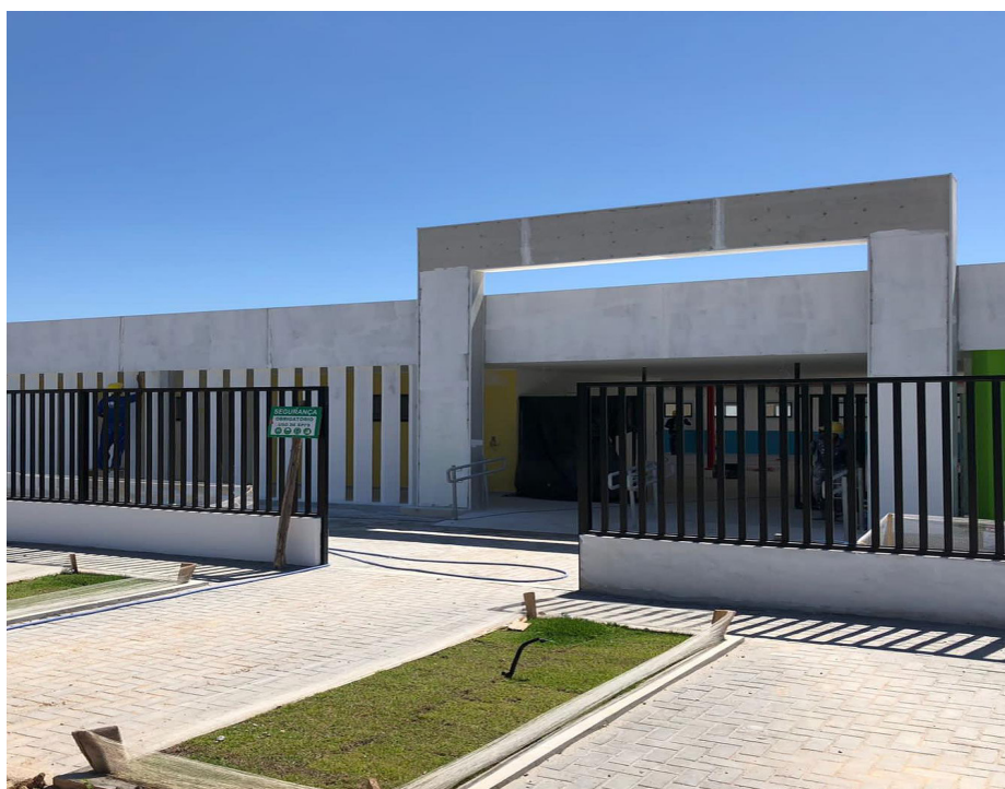
Além da unidade do bairro Bonsucesso, outras 14 serão construídas na cidade

Até o ano de 2024, 15 unidades serão inauguradas pela Prefeitura. Além de Bonsucesso, há obras no Asfalto Velho, Rio d'Areia, Ipitangas e Jaconé (duas creches). Mato Grosso, Palmital, Barra Nova e Vilatur terão obras iniciadas em breve.