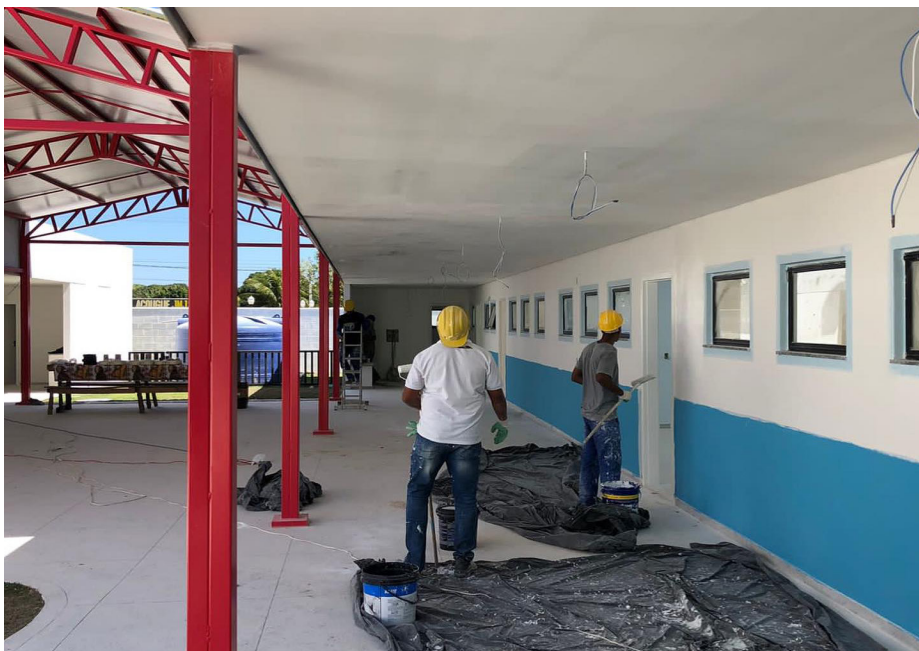
Creche do bairro Bonsucesso já ultrapassou o índice de 80% de conclusão

A Prefeitura de Saquarema, por meio da Secretaria Municipal de Obras Públicas, está finalizando a etapa de pintura do prédio, executando os retoques e acabamentos em demais pontos. A obra já ultrapassou os 80% de conclusão, estando na reta final para entrega, com prazo até janeiro de 2024. Após a finalização das etapas de construção, a Secretaria de Obras dará início à entrega e montagem dos móveis e eletrodomésticos da nova creche.