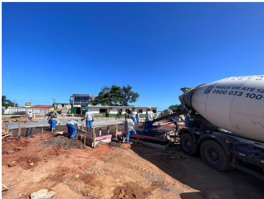
Equipes de obras trabalham na montagem das novas gavetas mortuárias do cemitério

A obra foi iniciada no mês de julho de 2023, com previsão de entrega em doze meses.