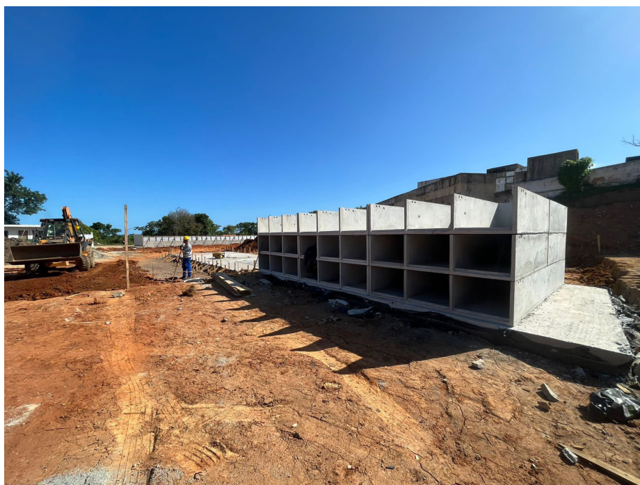
O espaço terá quase 2 mil novas gavetas. Obra tem previsão para término em 2024