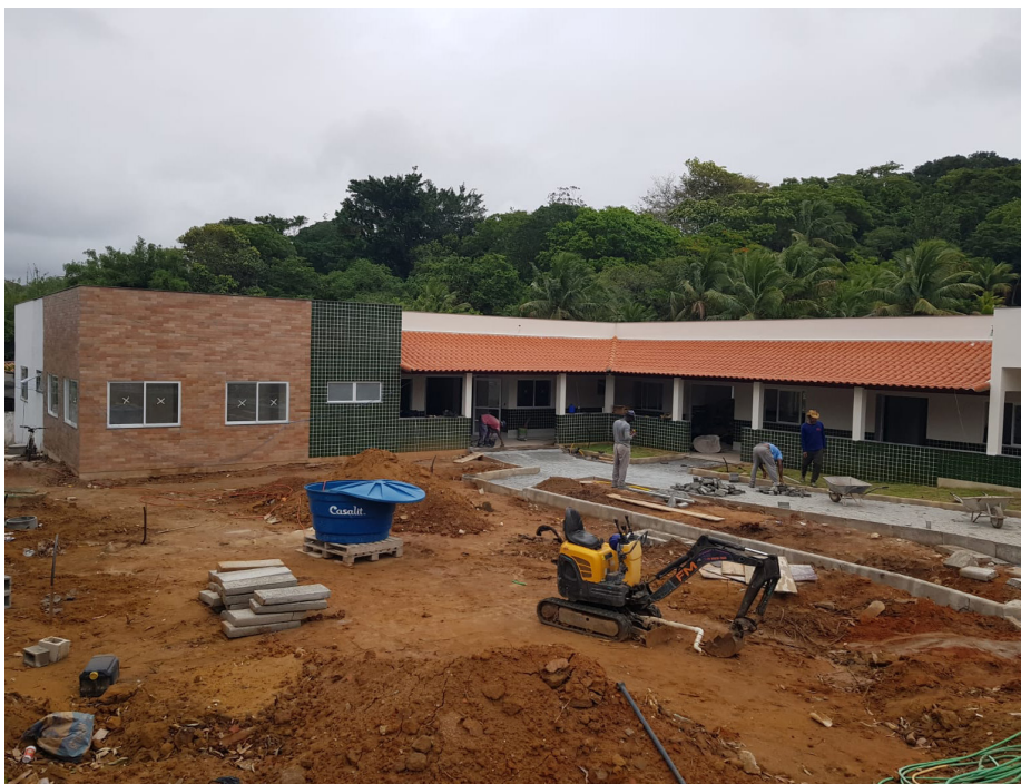
Obra de reforma e ampliação do Lar dos Idosos está sendo feita no Porto da Roça

A obra está sendo construída na Rua Umbelina Simões, no bairro Porto da Roça. De acordo com a Secretaria Municipal de Obras Públicas, 74% da construção já foi finalizada e a previsão de conclusão é para o mês de janeiro de 2024.