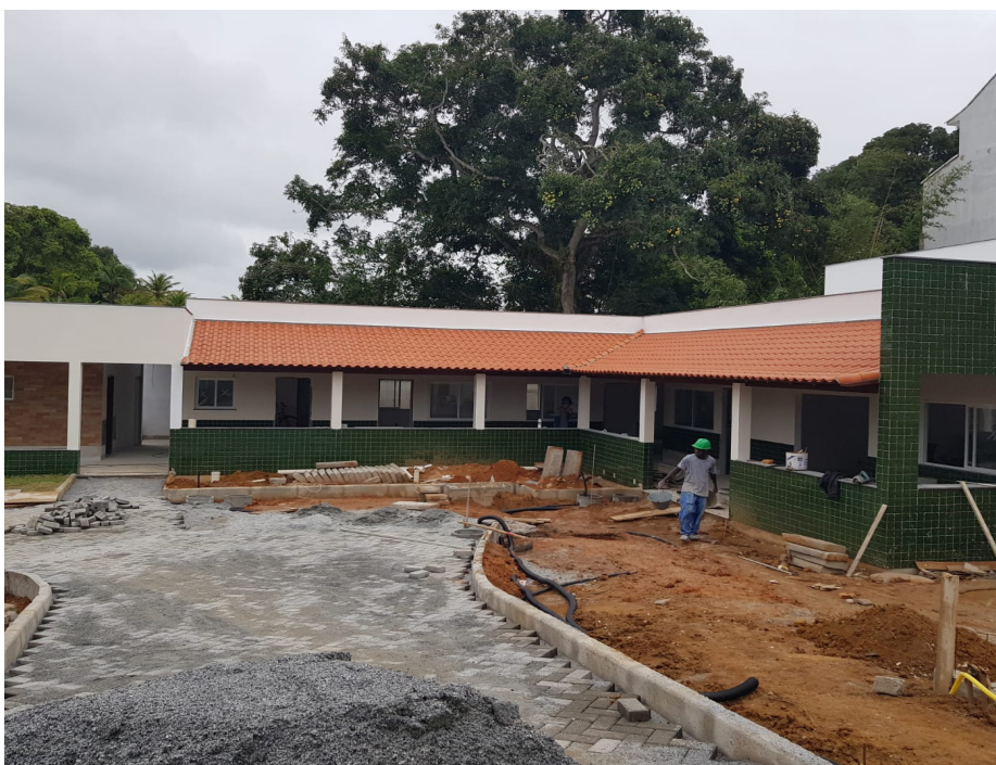
Equipes estão trabalhando na implantação do piso da área externa do local