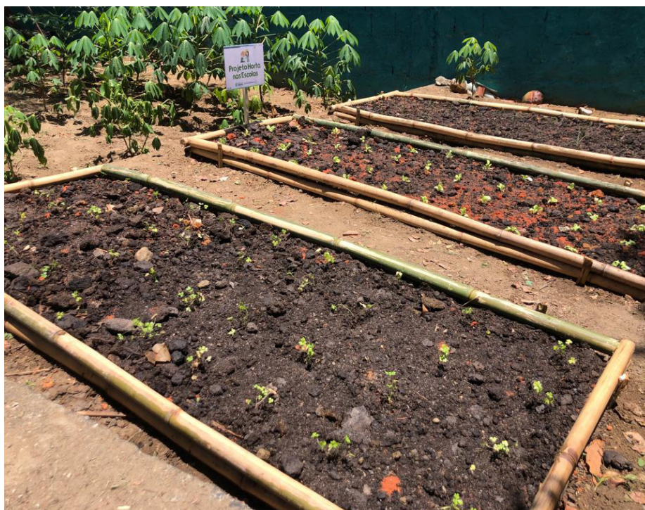
Alimentos são utilizados nas merendas e alimentações utilizadas nos prédios públicos