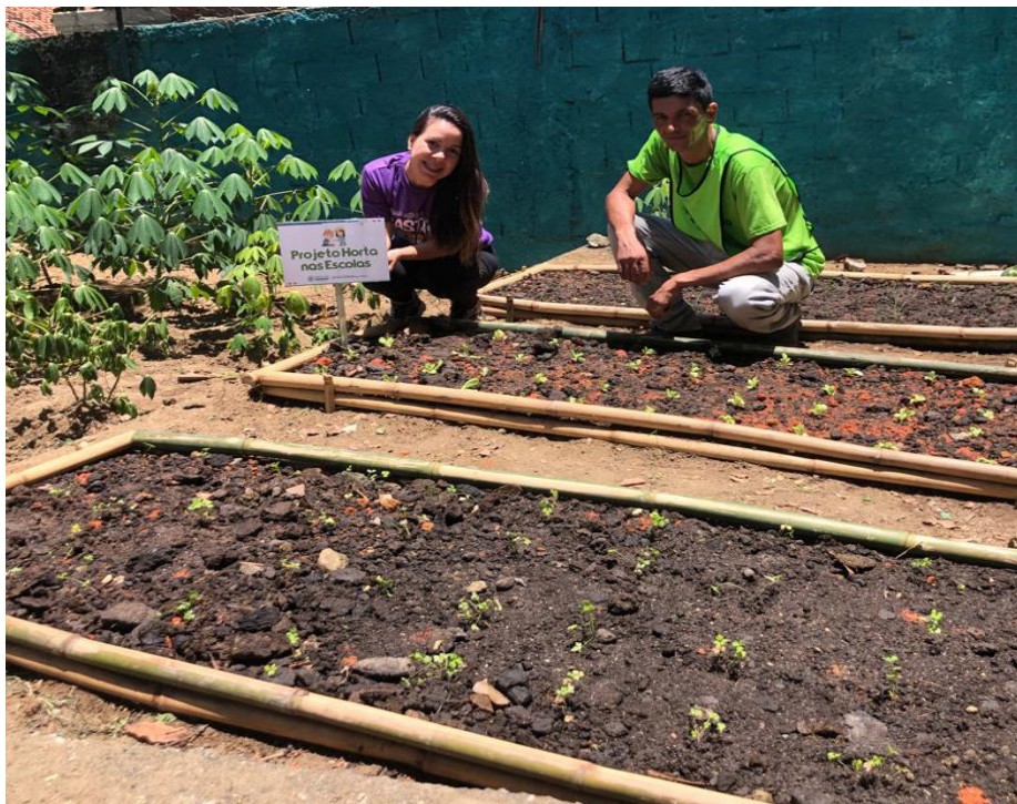
Projeto Horta: Secretaria de Agricultura monta estruturas em escolas e postos de saúde

A Secretaria de Agricultura dá a assistência técnica e implementa a horta. Além de auxiliar na alimentação, a horta também poderá ser usada em atividades lúdicas e educativas ofertadas pelo centro.