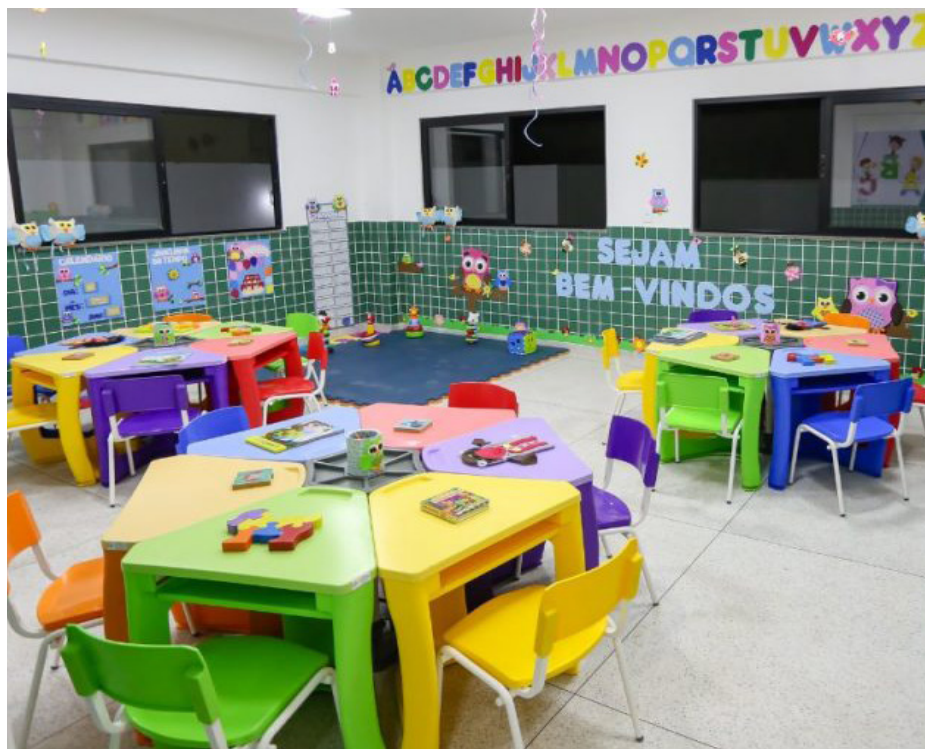
Pais e responsáveis deverão ficar atentos aos prazos para efetivação das matrículas

IV – Fotocópia da Carteira de Identidade do responsável