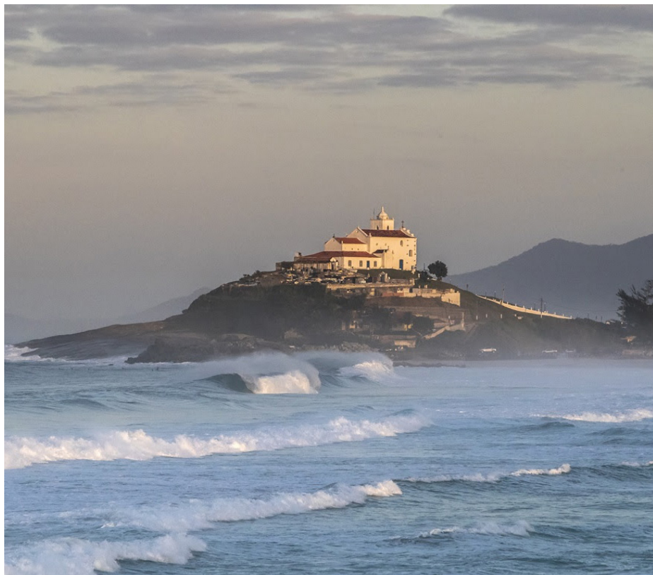
Saquarema é a única cidade do mundo a ter três competições oficiais da WSL

O calendário manterá a participação de 80 surfistas na