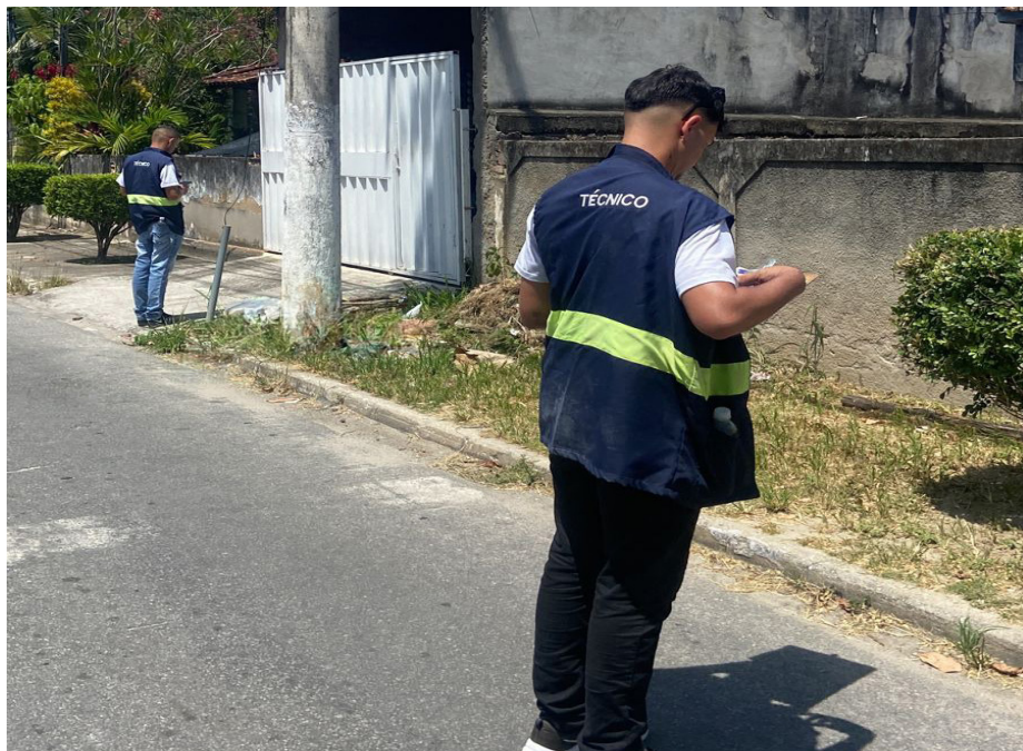
Técnicos do ITERJ já começaram a fazer as visitas às residências em Saquarema