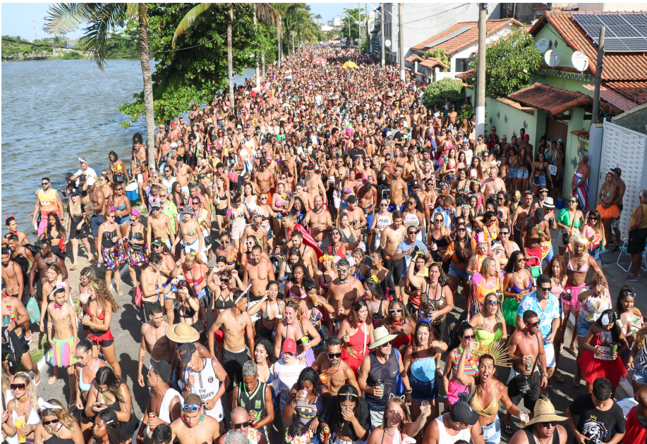
Orla da Lagoa de Saquarema terá interdições no trânsito durante o carnaval 2024

A Prefeitura de Saquarema montou um plano especial de atuação para o Carnaval na cidade. A força-tarefa envolve 215 agentes municipais todos os dias nas ruas, de diversos setores, como Fiscalização de Posturas, Proeis, Defesa Civil, Guarda Ambiental, Guarda Municipal e Salvamar. Para manter o ordenamento urbano e a segurança, o município contará com dois veículos-guinchos, 16 viaturas e quatro motocicletas.