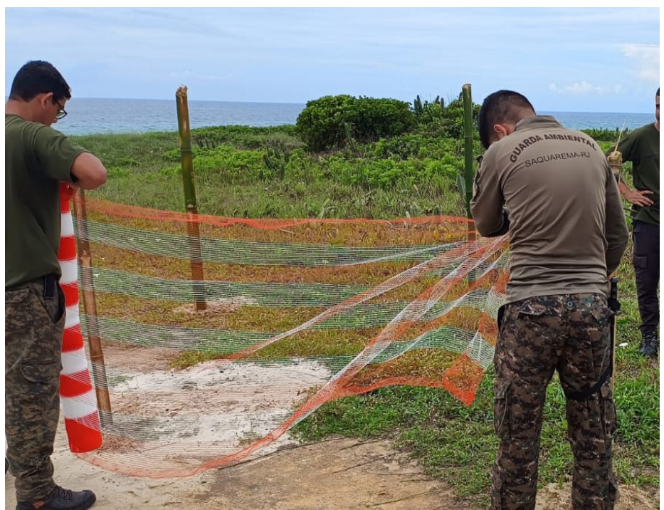
A Coruja Buraqueira tem grande importância na manutenção do ecossistema local