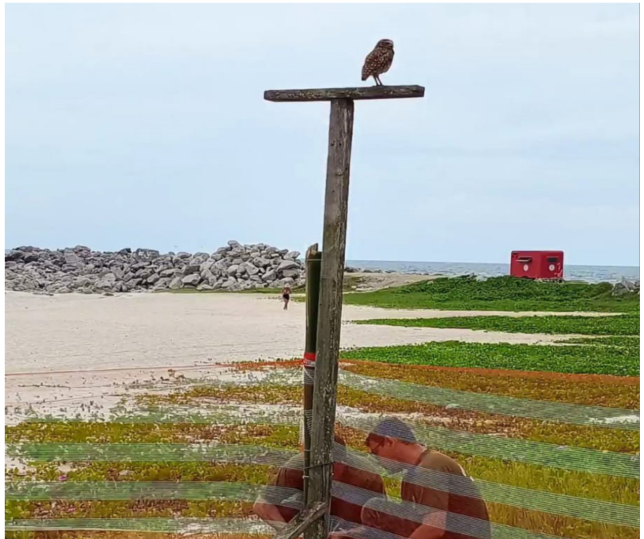
Cercamento das áreas de ninhos da Coruja Buraqueira na área da Barrinha, no Centro

A Guarda Ambiental de Saquarema informa que os locais alvo das ações são Área de Preservação Permanente (APP) e que perseguir espécimes da fauna silvestre constitui infração ambiental. Para mais informações e denúncias, entrar em contato com a Guarda, através do telefone 22 99279-0540 ou do e-mail guardaambiental@saquarema.rj.gov.br .